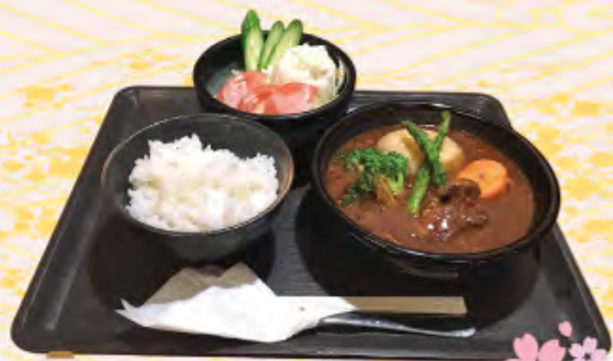
自家製ゴロゴロ ビーフシチュー定食 1400円