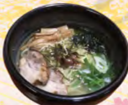
梅しおラーメン 760円