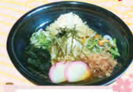
ぶっかけそば うどん 750円