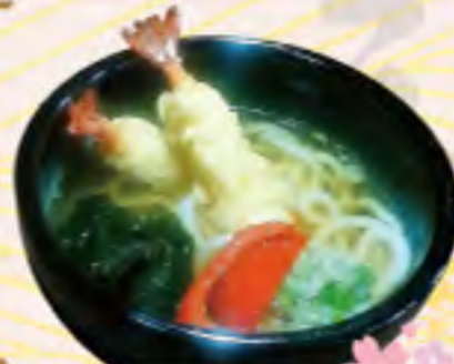
天ぷらそば うどん 950円