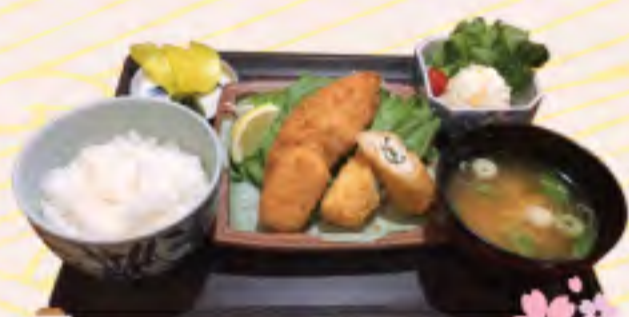
ミックスフライ定食 880円