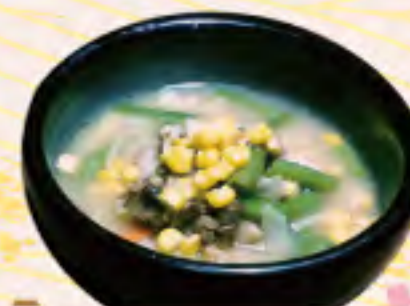
野菜たっぷり みそラーメン 760円