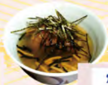
焼きおにぎり茶漬け 380円