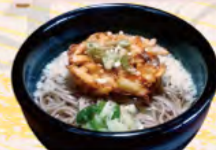
野菜かきあげそば うどん 700円