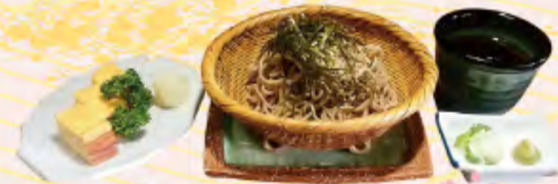
ざるそば・うどん 750円