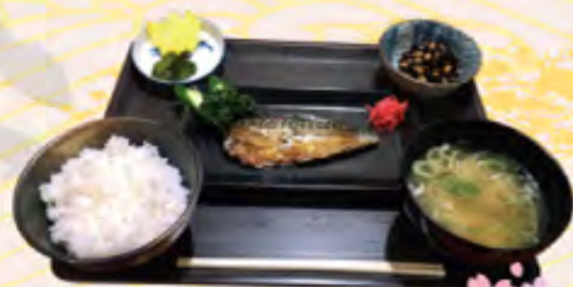
サバの味噌煮定食 800円