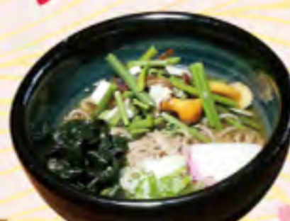
山菜そば・うどん 700円