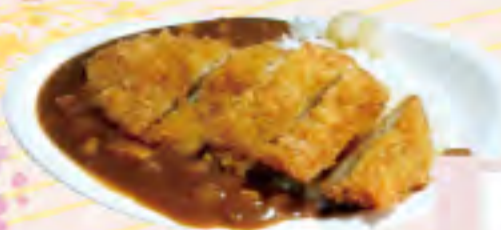
カツカレーライス 960円