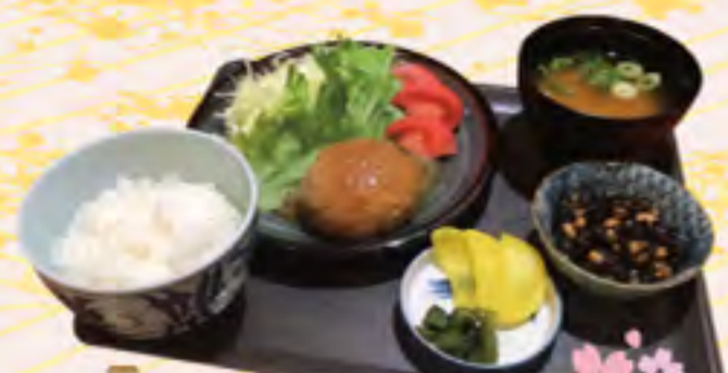
ハンバーグ定食 (おろし/デミ) 950円