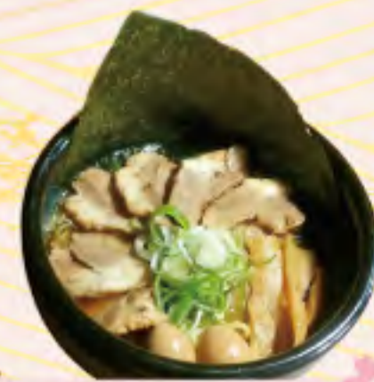
チャーシューメン 860円