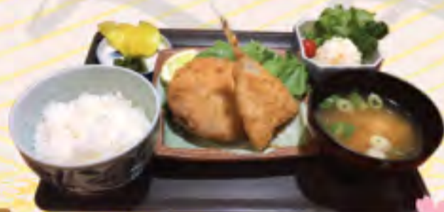
メンチ・アジフライ定食 850円