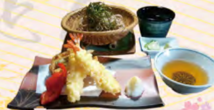
天ざるそば・うどん 1150円