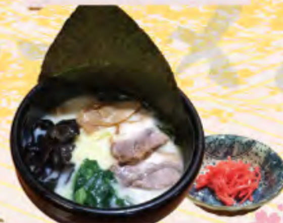
和風とんこつラーメン 760円